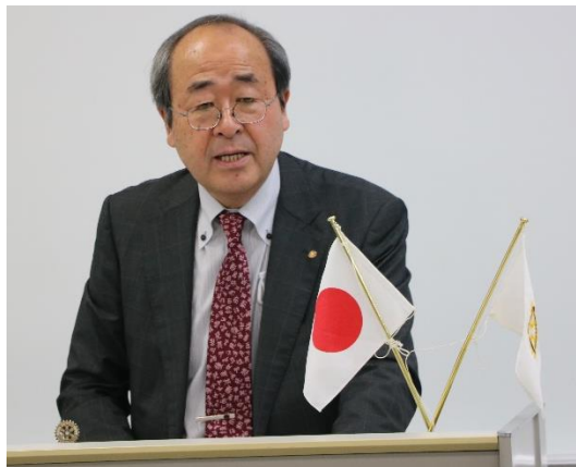
岡田 公開講演会実行委員長