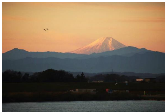
数年前に撮った正月二日の紅富士