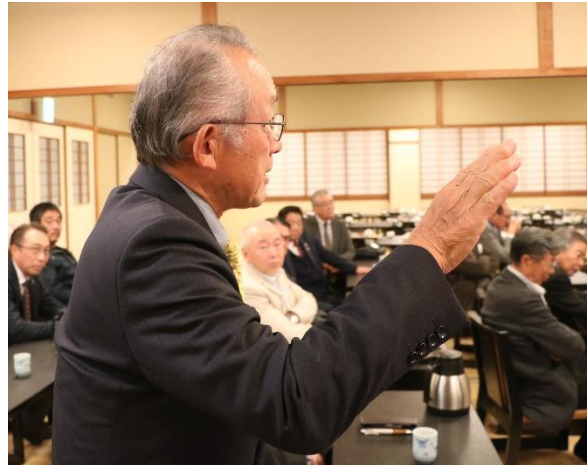
坂田会員、山本憲作会員、山本正幸会員、宮内会員、富田会員から秋葉プロに質問