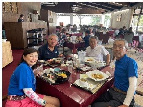
【桑名 CC】 もちろん朝起きてこなかった人もこの写真には入っています。