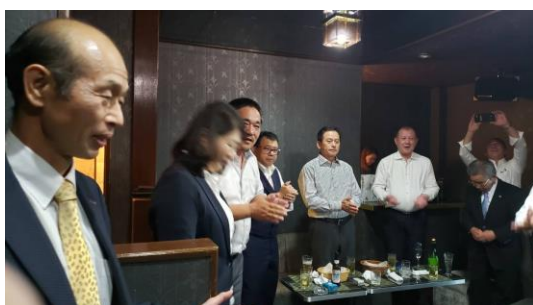
大谷次年度会長卓話・・・例会内食事