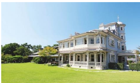
桑名北 RC 例会場六華苑