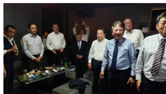
二次会(午後8時半～10時半)この中に、朝の5時まで飲んでいたら人あり。