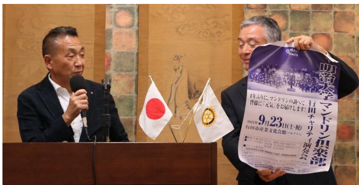
明大マンドリンクラブ定期演奏会のPR