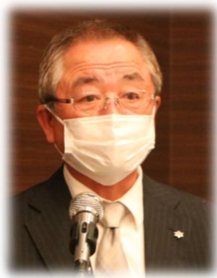
出席・ニコニコ松本委員長