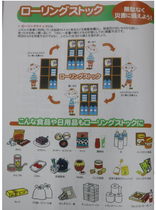
「ローリングストック」とは・・・