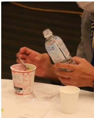
カップラーメン「水もどし」