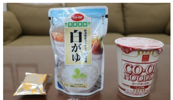
アンケートに答えて GET!