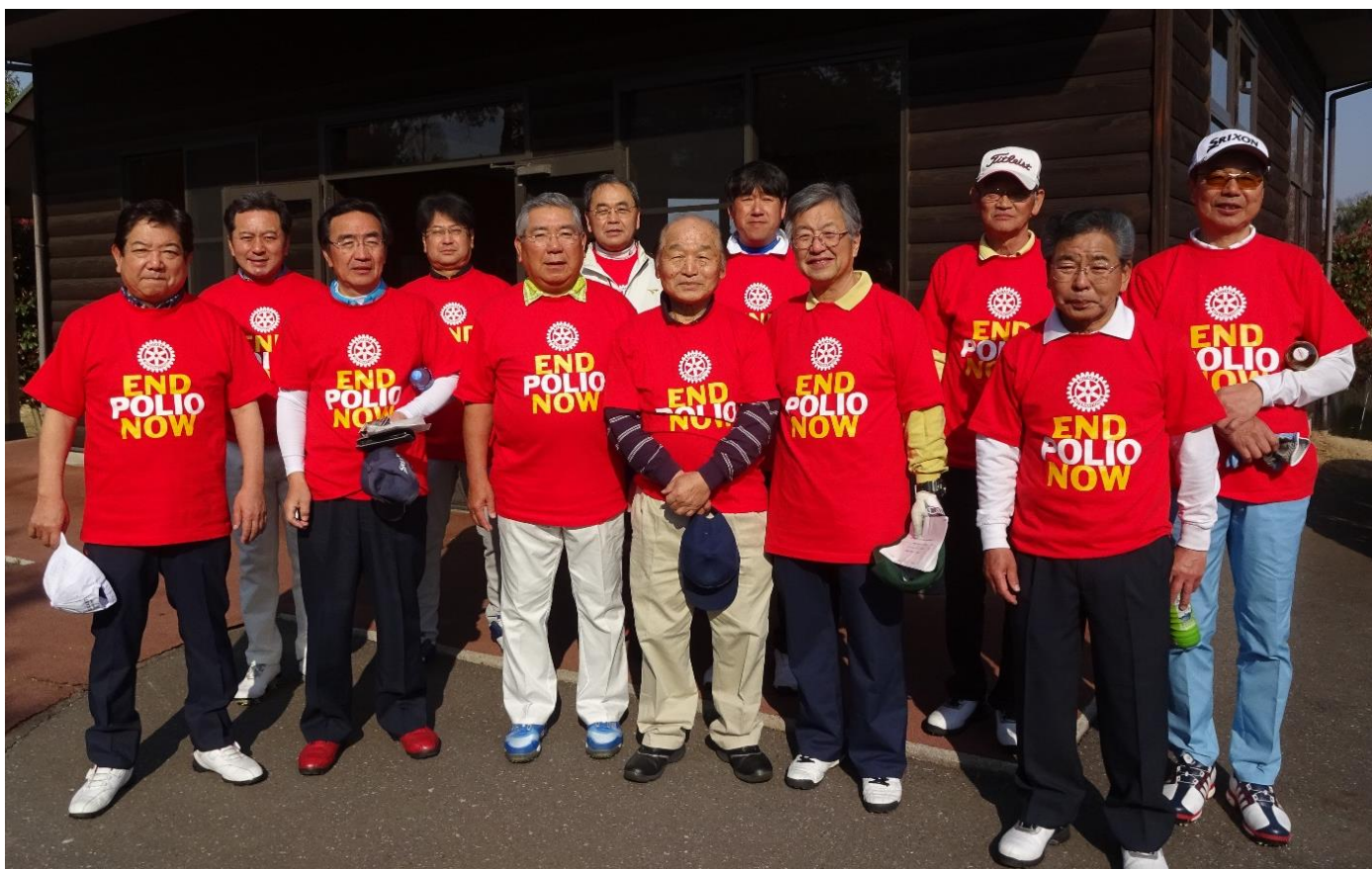
チャリティコンペ 記念Tシャツを着ての写真