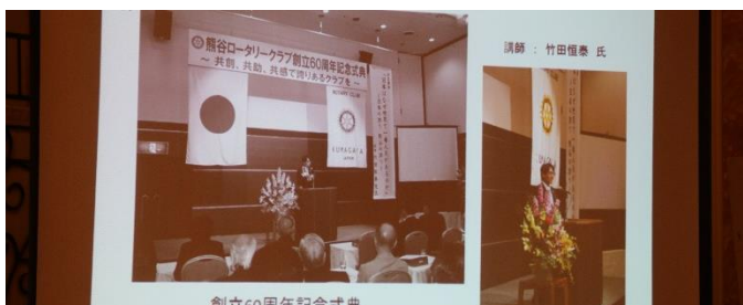
創立 60 周年記念事業