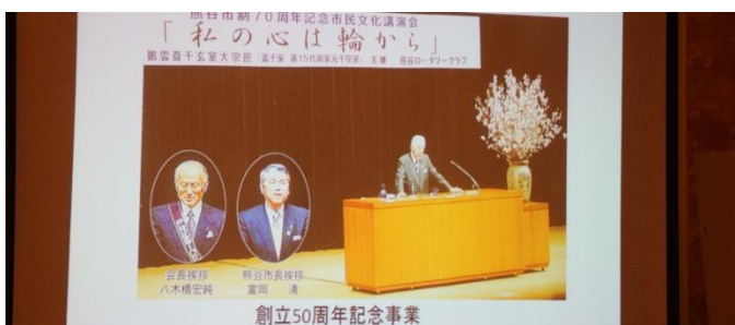
創立 50 周年記念事業