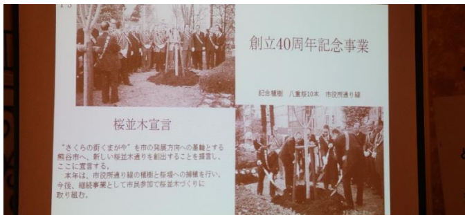
創立 40 周年記念事業