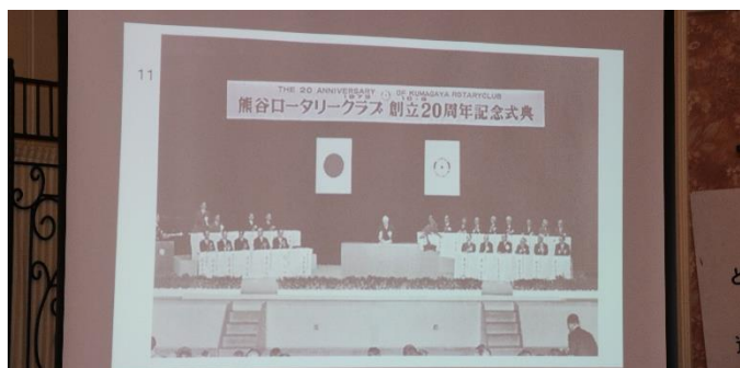
創立 20 周年記念式典