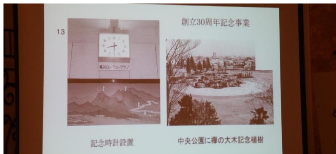
創立 30 周年記念事業