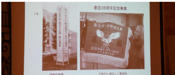
創立 35 周年記念事業