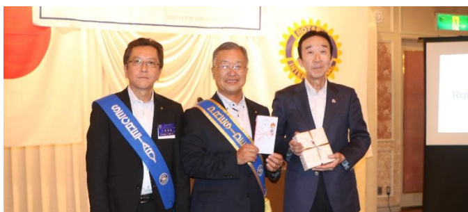
熊谷 RC 福島会長よりニコニコにお礼金を頂きました。