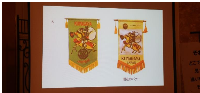
現在の熊谷ロータリークラブのバナー【右側】