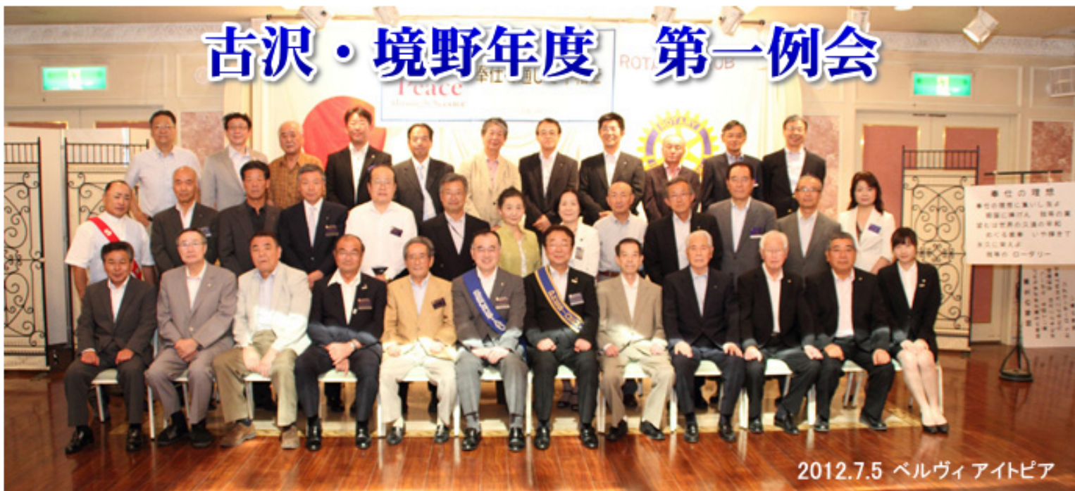
2012.7.5 ベルヴィアイトピア