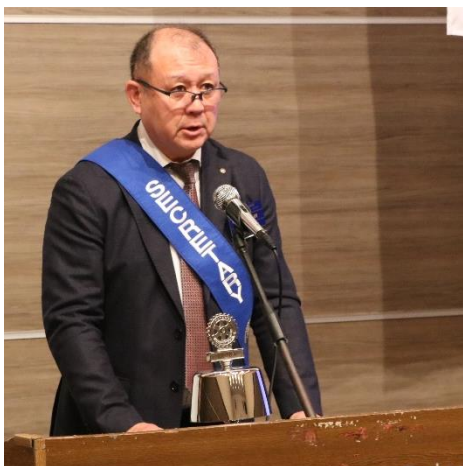
小池 幹事 幹事会の報告、次回例会の件