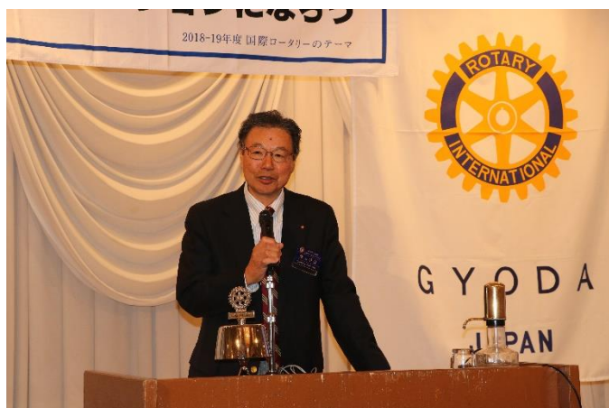
誕生祝お礼のあいさつ 蔭山会員