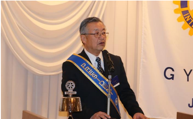
石 渡 会 長

皆様今晚は、お元気でお過ごしでしょうか、インフルエンザが流行しています。沖おつけください。