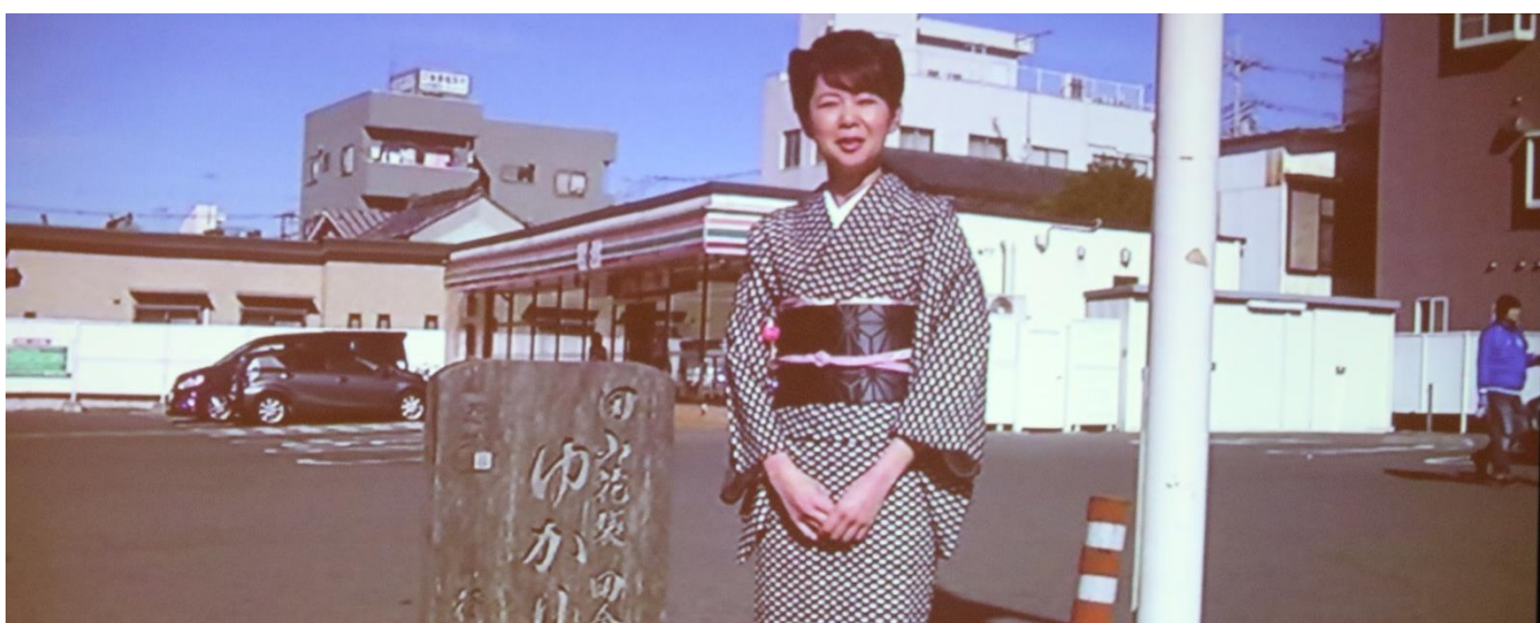
行田ロータリークラブ 事務所所属