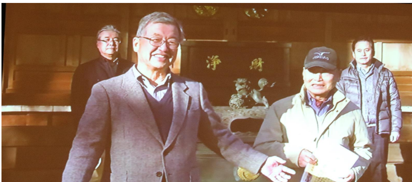
撮影監督 大谷純一監督