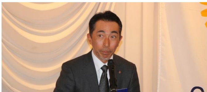
ビデオ製作の報告・挨拶 宮内会員