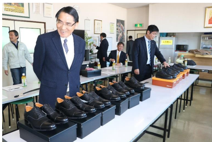
宮内社長のご厚意により格安にて販売していただきました