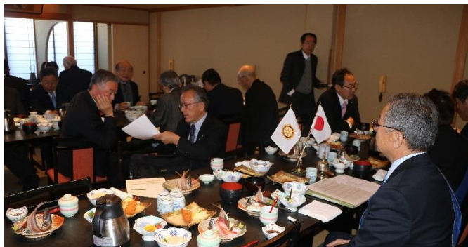
例会前 食事・打合せ