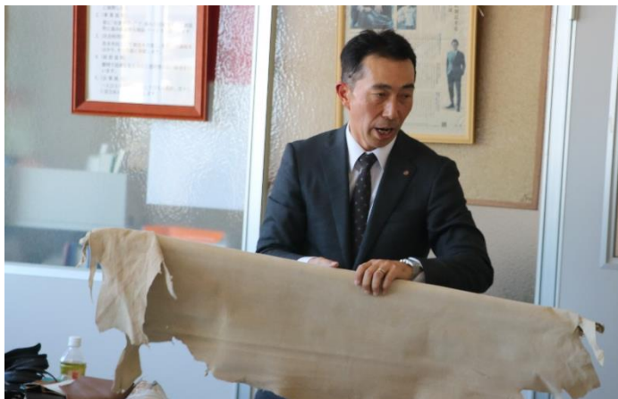
靴に使われる素材について説明して頂きました。