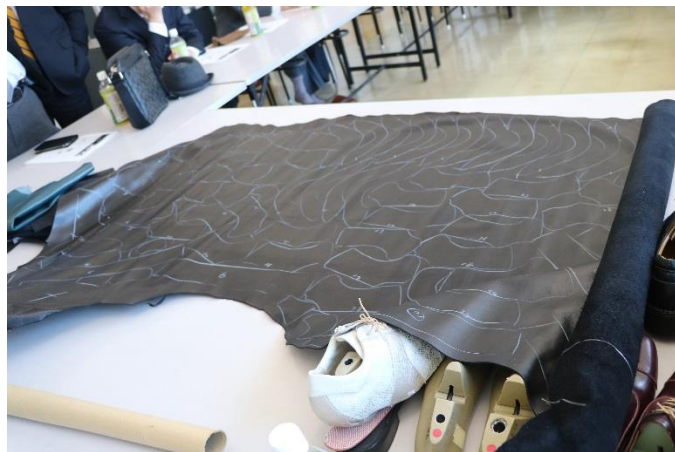
靴に使われるに素材の型取り