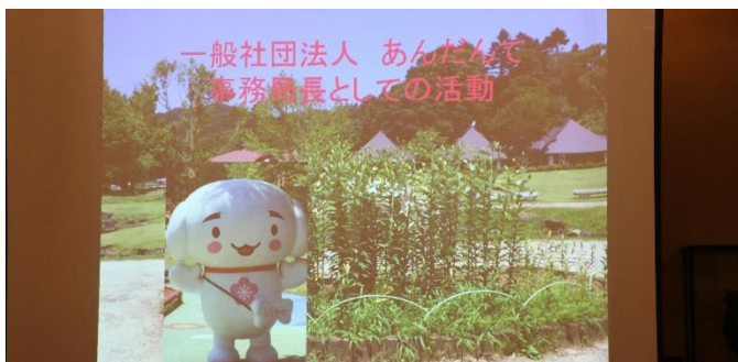
一般社団法人 あんだんて 事務局長としての活動 白河市内幼稚園たちと“花いっぱい活動” “ゆりゾーンいつくり”

“白河の名所をゆりの花でいっぱいになりたい”「一般社団法人あんだんて」が 3500 球の球根を寄付した。ピンクや赤などの華やかな品種が特に人気だそうです。7 月末頃まで楽しめる。