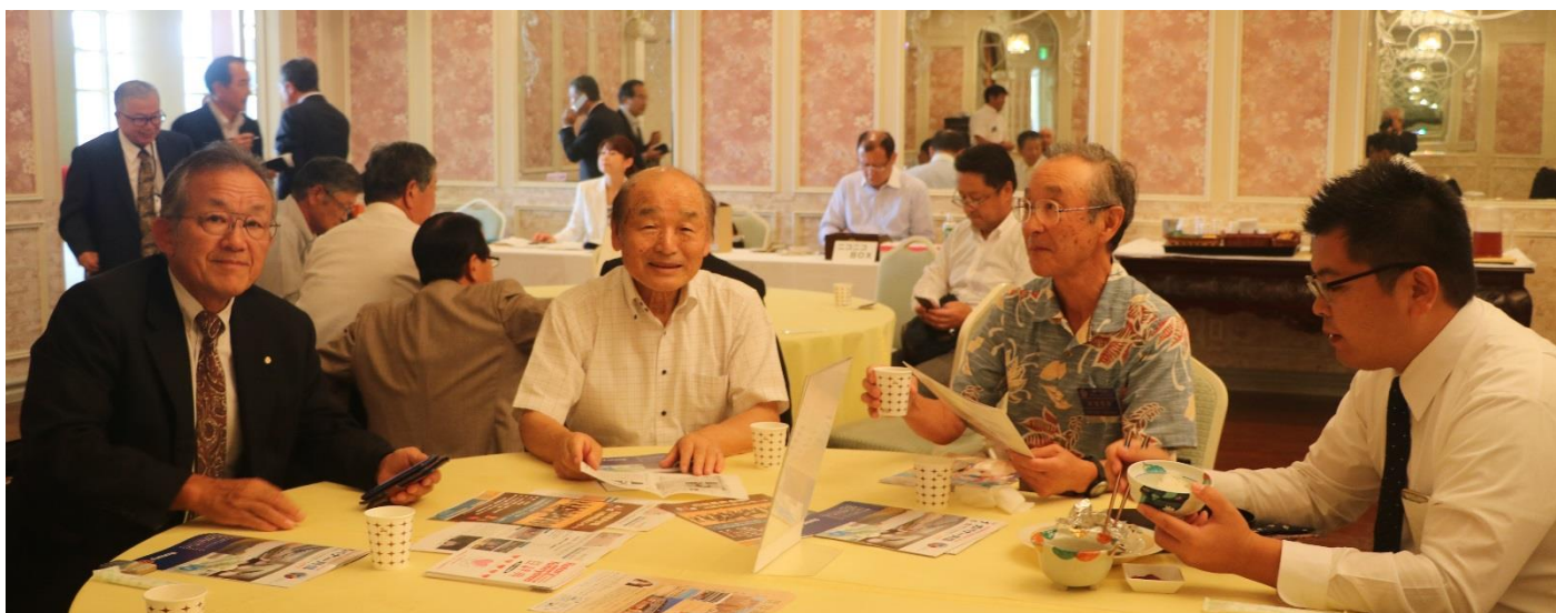
食事後 例会前の和やかなひととき 赤テーブル着席会員(クジ引き指定)