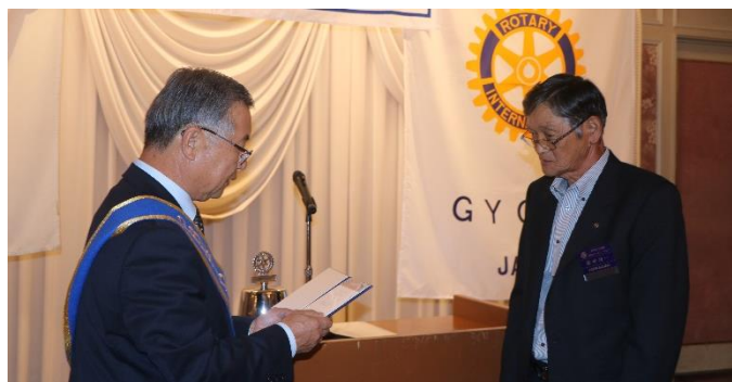
ロータリー財団ポールハリス・フェロー寄付 稲垣会員