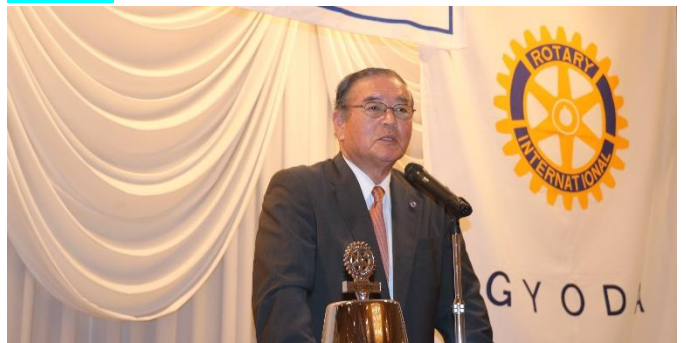
両親の言葉を胸に一人生に無駄はない