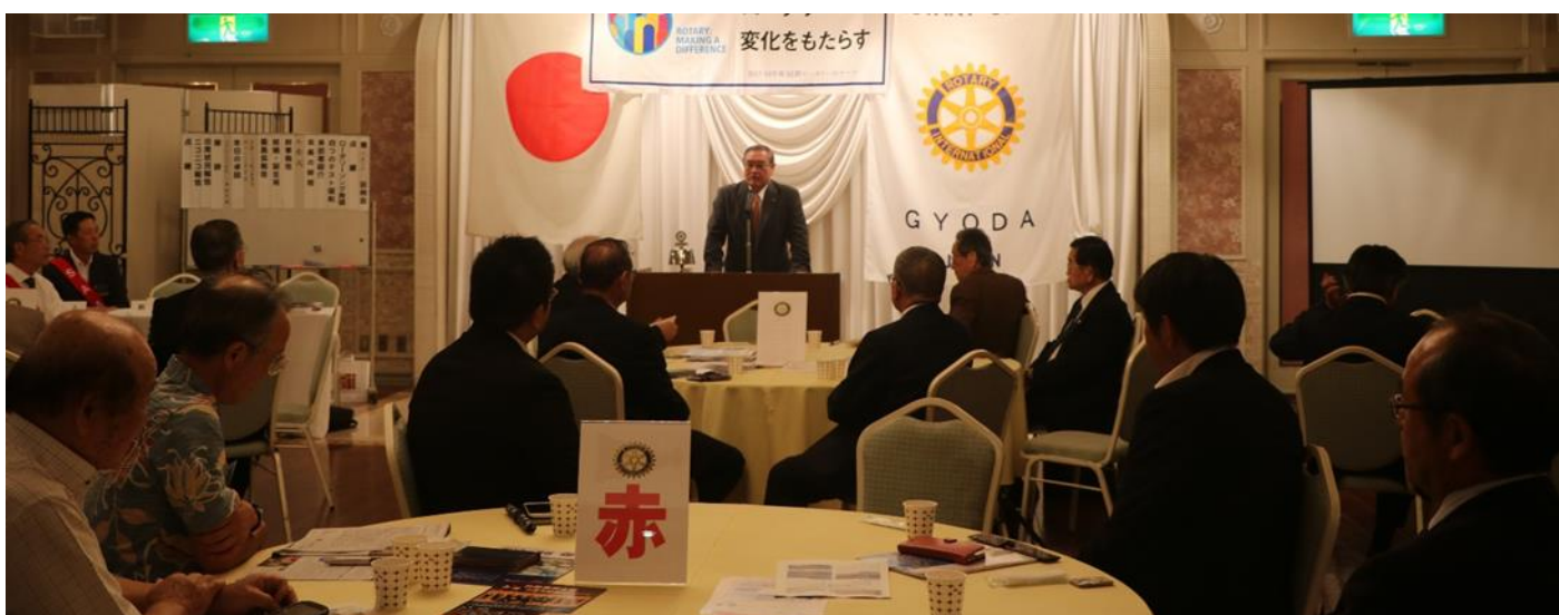
小島会長 卓話の時間