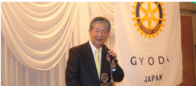
誕生祝い 御礼の言葉 鴨田会員